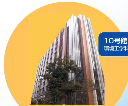
10号館(モノラボ) 環境工学科・応用化学科

向学心あふれる学生を最初に迎える赤煉瓦造りの「片岡 安メモリアルゲート」は、学園創設時の著名な建築家で、初代校長・理事長の片岡 安 博士が実施設計した「大阪中央公会堂」をモチーフにしており、大阪工業大学の英知とバイオニア精神を象徴しています。