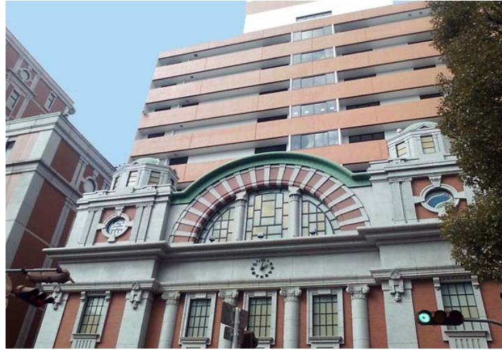
片岡 安メモリアルゲート(大阪工業大学正門)

〒535-8585 大阪市旭区大宮5丁目16-1 TEL.06-6954-4435 (事務室)