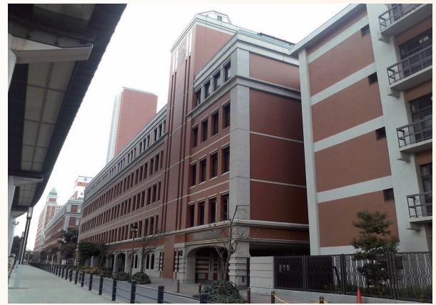
本館(常翔学園高等学校)

2008年4月、大阪工業大学高等学校はさらなる飛躍を目指し、常翔学園高等学校と改称しました。多様な個性の伸張、確かな学力の定着、職業観の育成を教育目標に、「特進コース」「薬学・医療系進学コース」「情報系進学コース」「普通コース」「総合コース」の5コースを設置。特長あるプログラムで、教育を展開する普通科の男女共学高校です。