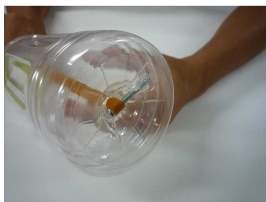
⑤ 底の部分で、輪ゴムに小ねじを通し、底に固定する。(小ねじの供回り防止に注意)