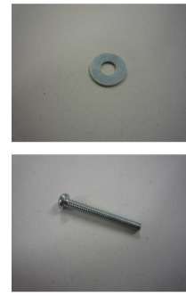
小ねじとワッシャー