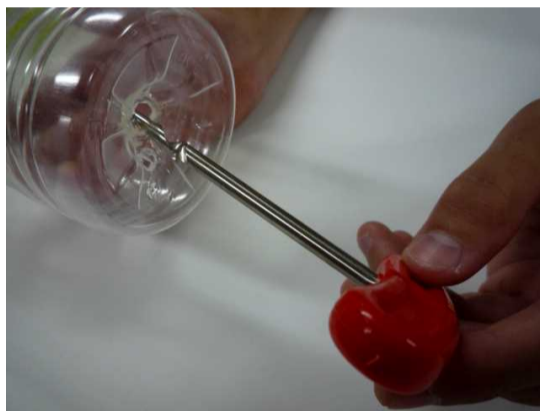
① ペットボトルの底に2カ所の穴を開ける