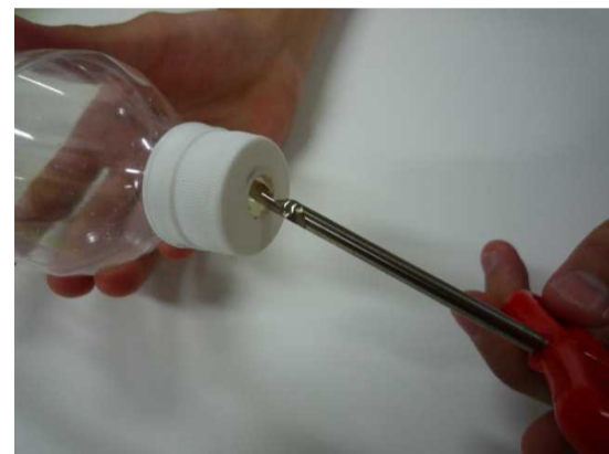
② ペットボトルのキャップの中心に穴を開ける