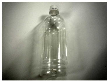
ペットボトル (円筒形)