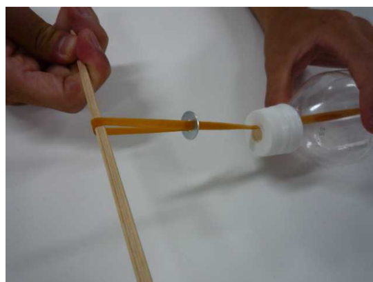
⑦ 輪ゴムをワッシャーの中を通し、わりばしにひっかける。