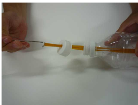
⑥ フタの穴に輪ゴムを通す。