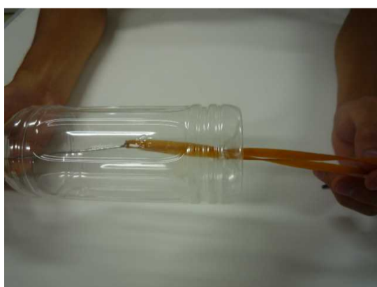
④ 底から輪ゴムを入れ、フックで引き出す。