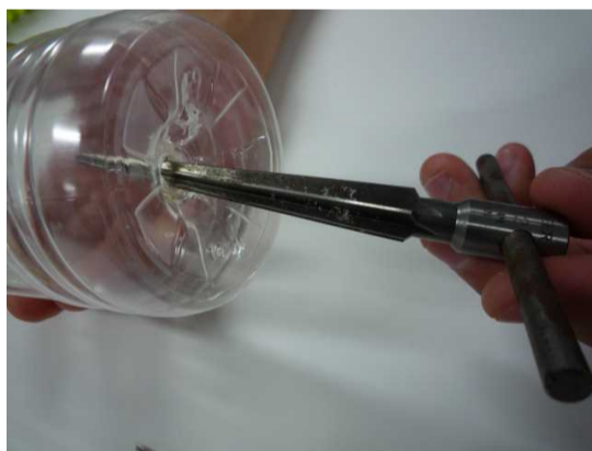
③ テーパーリーマーで、底の穴と、キャップの穴を広げる。