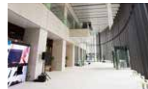
OITギャラリー [1階] 大阪工業大学のギャラリー空間も併設しており、サインージシステムとデジタルアーカイブによって、先進研究の一端を知ることができます。