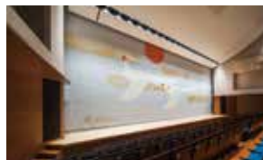
絨帳 絨帳の原画は、日本画家の上村淳之画伯作「翔(しょう)」。