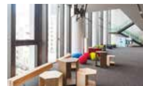
ホワイエ [3階] 学生がデザインした家具やオブジェクトを配置。家具は奈良県川上村の杉材を使用し、ぬくもりある空間としています。