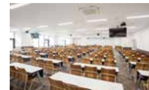
セミナー室 [2階] セミナー室は4室(54人/52人/141人/102人定員)。室内の椅子は大阪工業大学の学生が授業で開発・デザインしたものです。