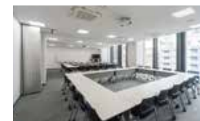
会議室 [3階] 24人が利用可能な会議室を2室用意。間仕切りを収納すれば、大会議室として利用することもできます。