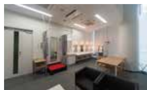
控室 [3階] 控室は2室を用意しており、演者の数に応じた利用が可能です。また、2階のクロックもご利用いただけます。