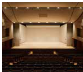
小編成オーケストラ