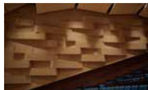
音響反射板 室内楽やジャズ、ポピュラーミュージックなど、さまざまな音楽に最適な残響時間の空間を実現しています。