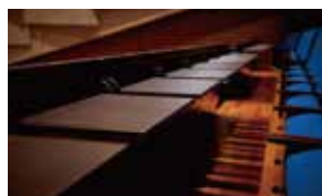
座席 シンポジウムや学会での利用を考慮した、テーブル付の座席。車いす席も4席確保しています。