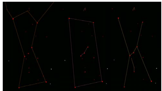
図2 オリオン座の比較 (左：現代 中央：古代中国 右：古代日本)