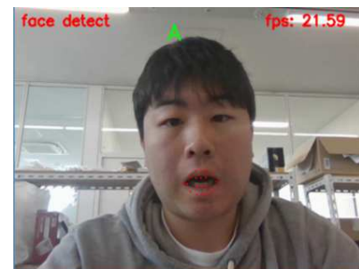
口唇画像切り出しの様子