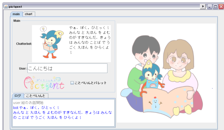
絵を用いた対話システム Pictgent(2012)