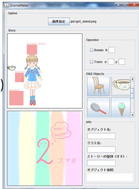
2コマ漫画の自動生成(2014)