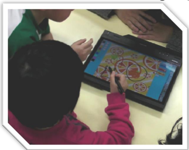
描いた絵に応じたアニメーションを付与するシステム CASOOK(2014)