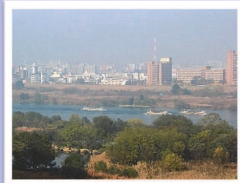
淀川を進む砂利運搬船