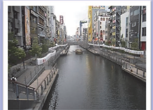
大阪のまちと道頓堀川