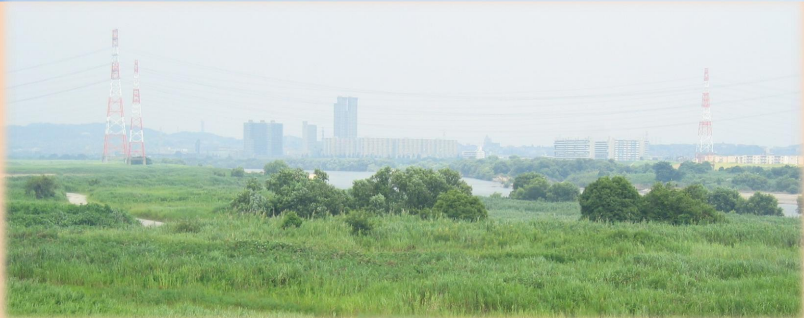
鶴殿のヨシ原(大阪府高槻市)