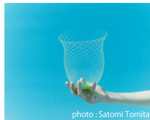
空気の器