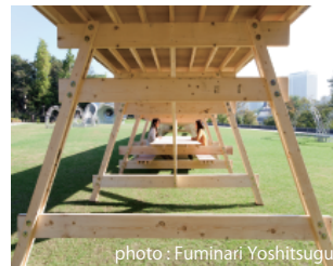
ガリバーテーブル