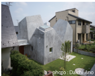
港北の住宅