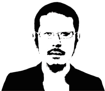
GUEST ファッションデザイナー