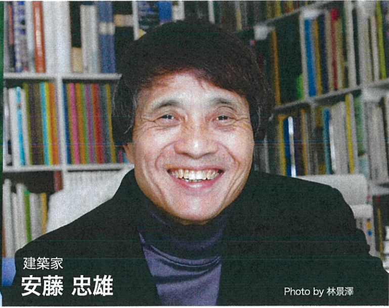
建築家 安藤 忠雄

ノーベル平和賞受賞者(2006年)、ユヌス・センター会長、グラミン銀行創設者。ソーシャル・ビジネスとマイクロ・クレジットの父。24カ国63の大学の名誉教授、並びに33カ国から米国大統領勲章、マグサイサイ賞をはじめ、136の賞を受賞。「最も偉大な起業家の一人」(フォーチュン誌2012)にステイブ・ジョブズやビル・ゲイツと共に選ばれる。