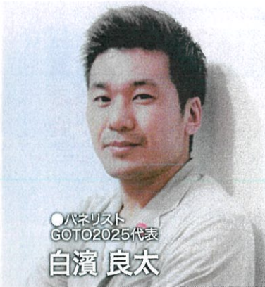
○ハネリスト GOTO2025代表 白濱 良太

大阪生まれ。独学で建築を学び、「住吉の長屋」で日本建築学会賞を受賞。世界的な建築作品でAIAゴールドメダルをはじめ数多くの受賞歴を持つ。そのほか「桃・柿育英会 東日本大震災遺児育英資金」実行委員長、イェール、コロンビア、ハーバード大学の客員教授を歴任。1997年より東京大学教授、2003年より名誉教授を務める。