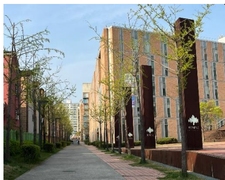
大田大学校のキャンパス