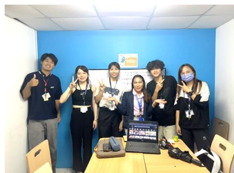
語学学校の先生・クラスメイトと

留学先で同世代の挑戦する姿に触れ、英語を磨く人や英語で起業に挑み実行している人が多いと知り、大きな勇気をもらいました。日本にいたら実感できない刺激があり、英語学習だけでなく、価値観や将来の選択肢も広がります。海外でしかできない経験を重ねるほど自信がつくので、迷っているならぜひ一歩を。GLCもおすすめで、費用は将来への投資だと思います。行けば必ず新しい発見と成長があります。