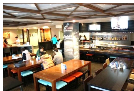
語学学校のカフェテリア