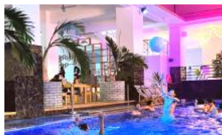
語学学校のプール