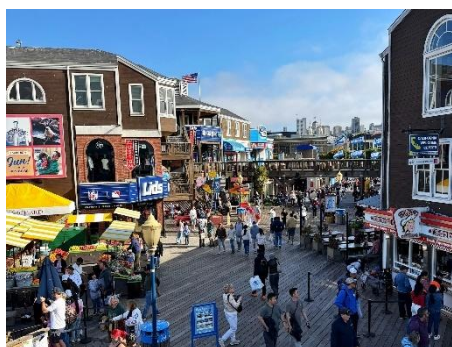
フィッシャーマンズワーフにて