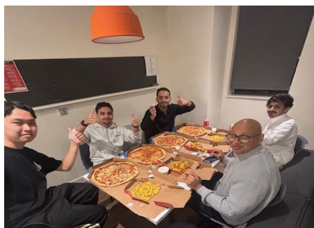
オックスフォード大学寮で仲間とピザパーティー