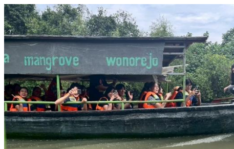
マングローブの植林活動に向かう参加者