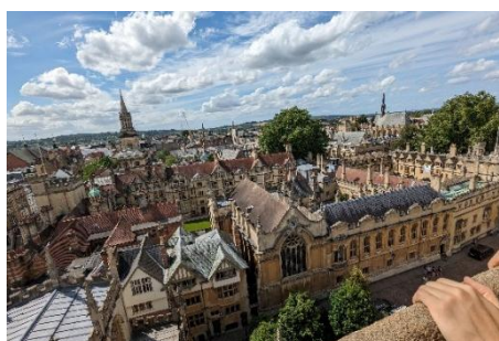
オックスフォードの美しい街並み

[ロボティクス&デザイン工学部空間デザイン学科3年] 2025年夏3週間プログラムに参加