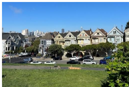
宿泊先ホテル近くの美しい街並み