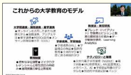
第2回FDフォーラムの様子