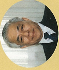
運営委員会委員長 西澤 潤一 (学校法人上智学院顧問 上智大学特任教授)

日本が今後進むべき道は、道義の再建と共に科学技術の振興を中心としなければならぬ。これはもはや明確になっている。米欧、アジア各国が懸命の努力をしている中で、資源、その他の点で条件の悪い日本は従来以上に独創的な研究開発に力を入れていかねばならない。