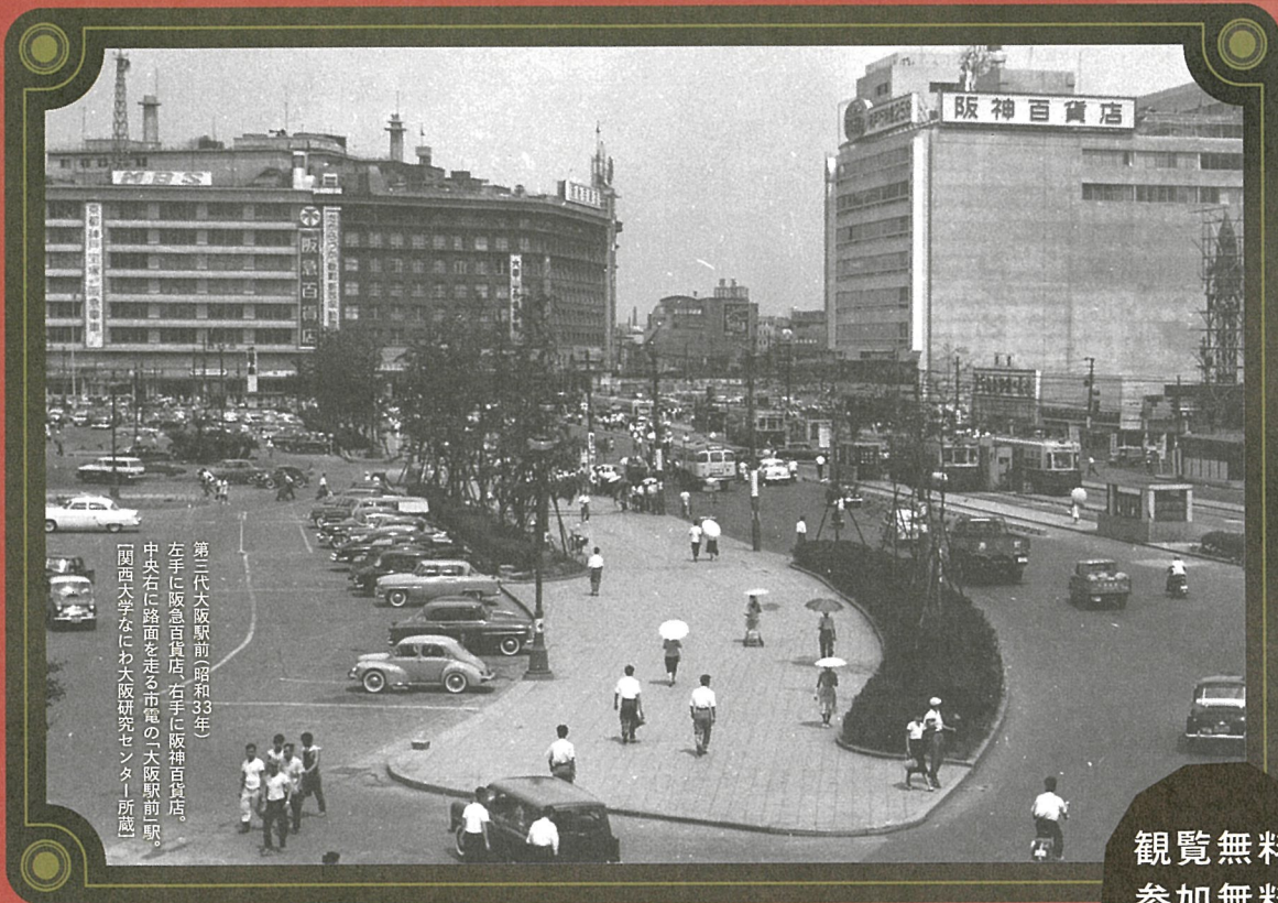
第三代大阪駅前(昭和33年) 左手に阪急百貨店、右手に阪神百貨店。 中央右に路面を走る市電の「天駅駅前駅」。