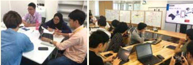
国際PBL(マレーシア・サバ大)受入

2017年度に、梅田キャンパスのロボティクス&デザイン工学部に入学した学生も、3年目を迎えました。今年度、3年次前期から始まる必修科目である「ものづくりデザイン思考実践演習I」は、1・2年次で学んだデザイン思考と基礎知識・技術をベースに、実社会の課題解決を目指します。学生は、グローバルや産学連携など右の表の19プログラムの中から1つのプログラムを選択。前半の第1クォーターでの事前学習を経たのち、後半の第2クォーターでは現場で実践学修に取り組みます。第2クォーターに開講される3年次向け専門科目は同演習のみのため、学生はおよそ3か月間1つの学びに専念することになります。海外実習(海外協定校とのプロジェクト他)や地域連携、産学連携の取り組みなど、多様な経験ができます。3学科(ロボット工学科・システムデザイン工学科・空間デザイン学科)横断の授業展開で、多様なバックグラウンドをもつメンバーでのグループワークを通して問題解決能力を養います。