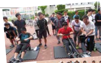
「エルゴメーター」でタイムレース!!

参加者は、まず最初に漕艇部員のアドバイスを受けながら動作の練習を行い、少し戸惑いながらも徐々に感覚をつかんだ上でエルゴレースに挑みました。レース本番はタイムレース形式で行い、中には漕艇部員も驚くような好タイムを叩きだす参加者がいて、性別や年齢に関係なく参加者全員が闘志を燃やし、大変な盛り上がりでした。白熱した伝統のある大会は大盛況に終わり、レースを通じて参加者相互の絆が強くなったような、大変思い出深い機会となりました。