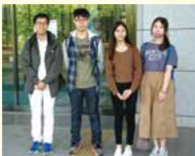
香港城市大学の短期留学生

5月21日、情報科学部に本学協定校の香港城市大学(中国)から4人の短期留学生がやって来ました。4人の短期留学生は、香港城市大学でも情報システム等を専攻しており、本学部でも情報システム等に関する専門科目と日本語Ⅰ・Ⅱの授業を聴講しました。短期留学生の授業の聴講にあたっては、今夏、本学部から香港城市大学に派遣予定の4人の学生が日本語で行われる授業の説明をする等のサポートを行いました。短期留学生と派遣予定の学生間で日本語・英語でのコミュニケーションは簡単ではなかったようですが、授業中お互いが知っている専門用語等が出てくると、それがきっかけで授業のサポートや意思疎通も上手くできたようです。