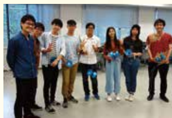
ジャグリングクラブのクラブ体験を終えて

4人の短期留学生は、この滞在の終わりに「In OIT, we have learned a lot of things. 2 weeks are really fast.」と感想を述べ、帰国の途につきました。