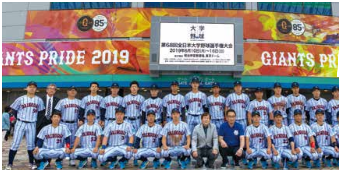
東京ドーム前で記念撮影

5月12日、体育会硬式野球部が加盟する近畿学生野球連盟のI部リーグ戦最終戦が豊中ローズ球場で開催され、本学が神戸大学を4-3と接戦の末に下し、1953年秋季リーグ戦以来66年(131季)ぶり2回目の優勝を果たしました。