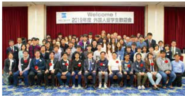
これからよろしくお願ひします!